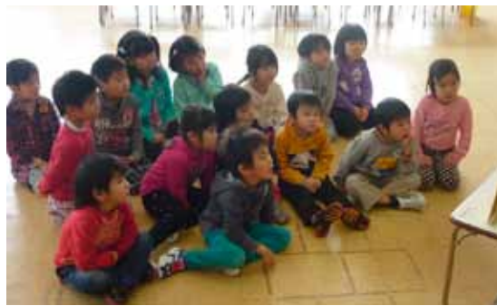
ゆり組、ひまわり組におじゃましました。