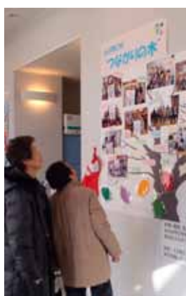
つながりの木の写真展示